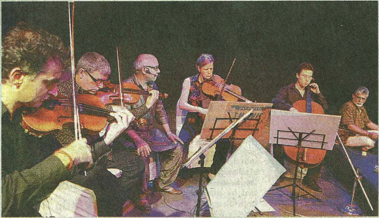
തൃശൂരിൽ നടന്ന 'ഏതോ ഒരിടത്ത്' സംഗീത പരിപാടി